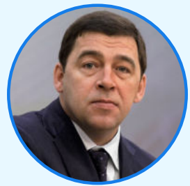
ЕВГЕНИЙ КУЙВАШЕВ Губернатор Свердловской области