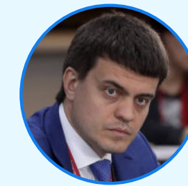
МИХАИЛ КОТЮКОВ Исполняющий обязанности губернатора Красноярского края