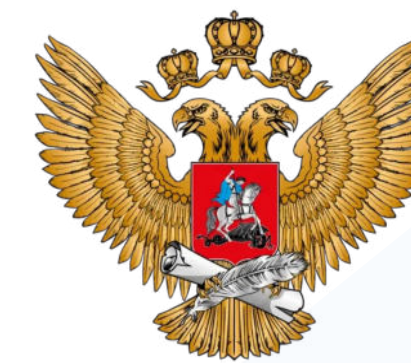
МИНИСТЕРСТВО ПРОСВЕЩЕНИЯ РОССИЙСКОЙ ФЕДЕРАЦИИ