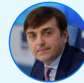
СЕРГЕЙ КРАВЦОВ Министр просвещения Российской Федерации