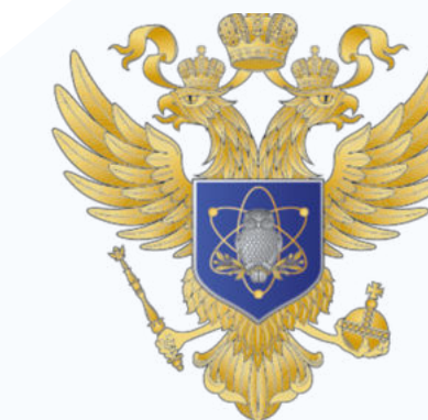
МИНИСТЕРСТВО НАУКИ И ВЫСШЕГО ОБРАЗОВАНИЯ