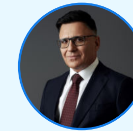
АЛЕКСАНДР ЖАРОВ Генеральный директор холдинга «Газпром-Медиа»